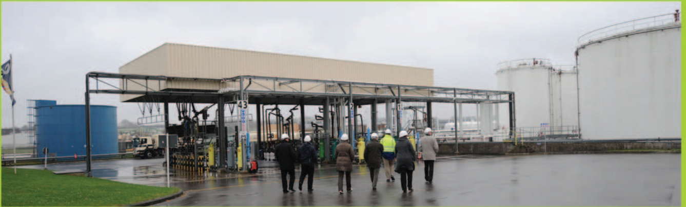
Die CSV Bartringen informiert sich über die Risiken und Notfallpläne der Tanklager. Le «CSV» s'informe sur les risques et plans d'urgence des stocks pétroliers.

Les citoyens ont droit à une politique inspirant la confiance qui renforce leur sentiment de sécurité et préserve la sécurité publique. Une telle politique doit également prendre des mesures en faveur de la santé. Le « CSV » apprécie et soutient le travail de tous ceux qui interviennent d'une manière professionnelle ou bénévole dans ces domaines. En même temps, le « CSV » sait estimer à sa juste valeur l'engagement des employés de la commune.