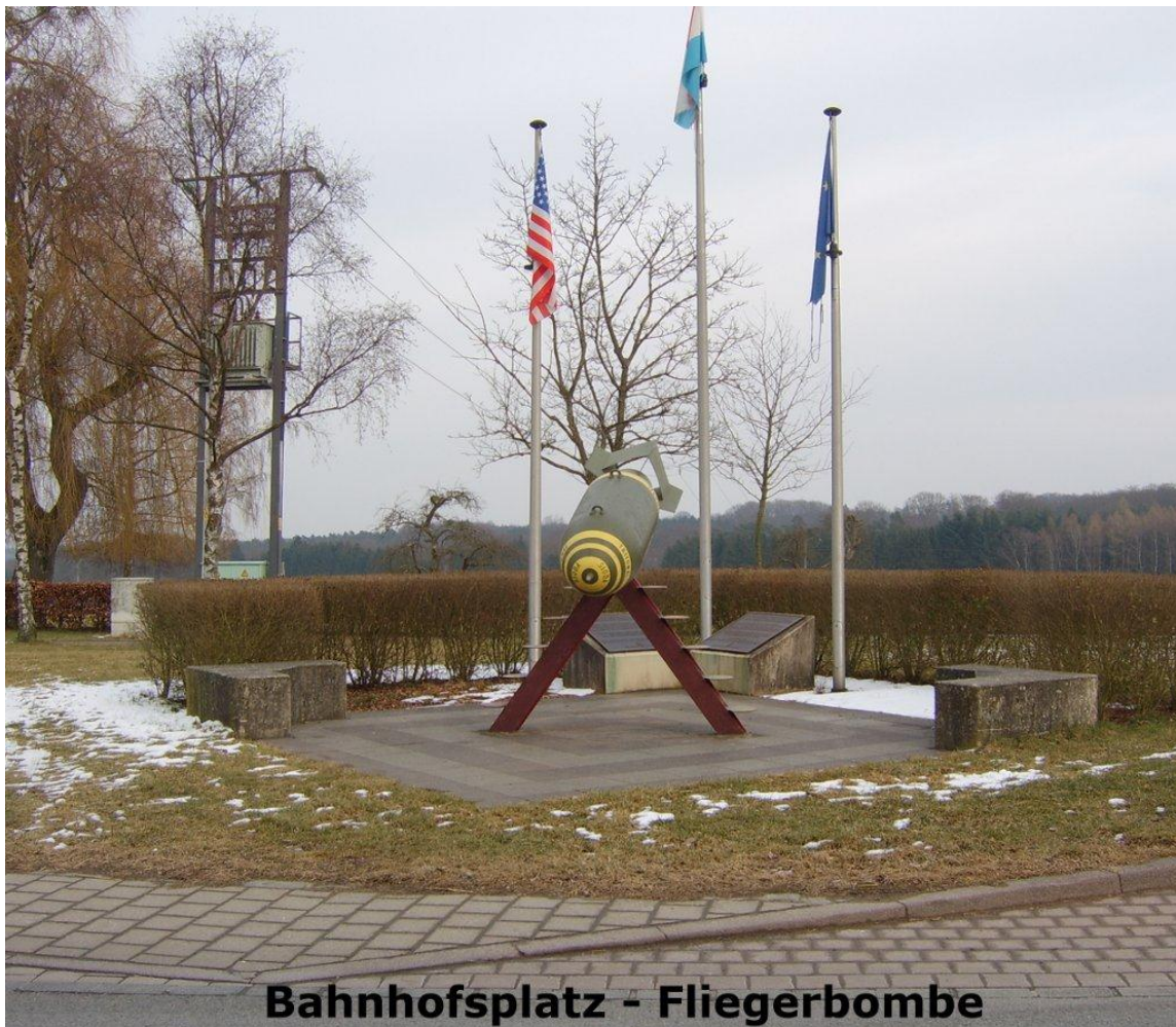
Bahnhofsplatz - Fliegerbombe

(Bahnhofsplatz Consdorf, route de Luxembourg, Huelewée, Niederbierchen, Häerdbach, Rittergang, Déiwepëtz, Kuelscheier, Seitert)