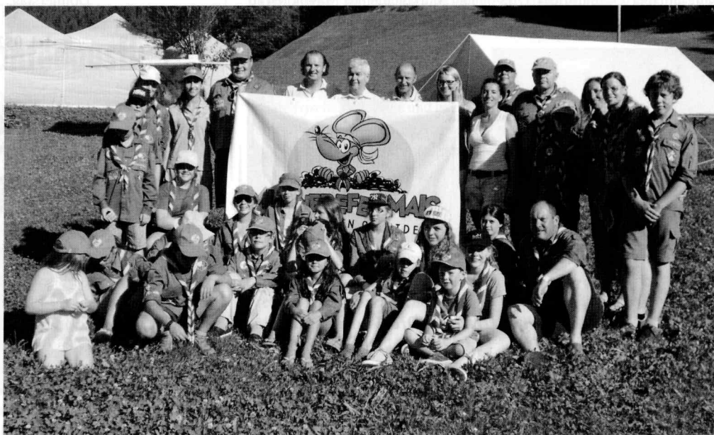
Etwas mehr als 30 Jugendliche der Pfadfinder „Munnerefer Mais“ kamen mit Gemeindevertretern auf dem Zeltplatzlager zusammen.

Anlässlich des Grillfestes am Mittwoch fanden sich auch einige Jugendliche aus Mayrhofen ein und es