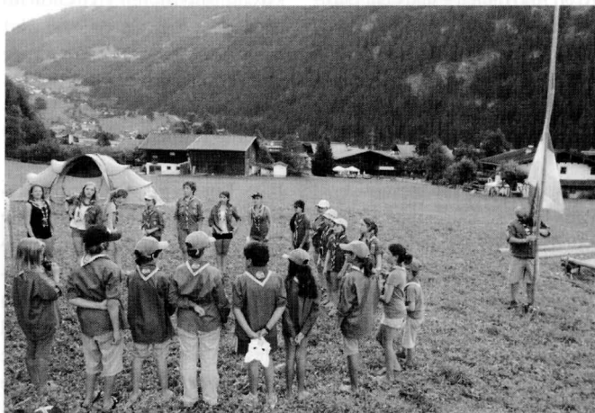
Das Hissen der Pfadfinderfahne am Morgen nach dem Aufstehen und die Einholung derselben vor der Betruhe am Abend gehört in Verbindung mit einem Lied und der Pfadfinderparole zum festen Ritual im Tagesablauf.