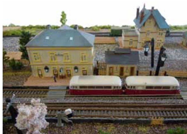
Maquette de J. Weber (1984)

Les objets proviennent de plusieurs collections privées ainsi que des « Frënn vun der Atertlinn ».