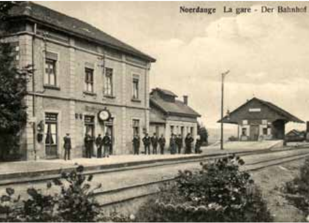
Gare du PH en 1914