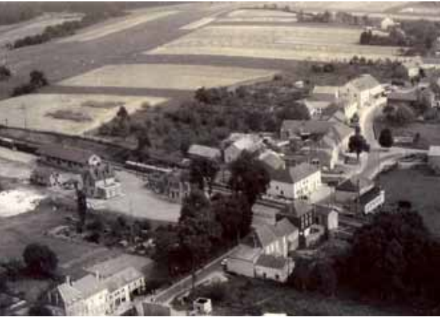
Noerdange en 1958