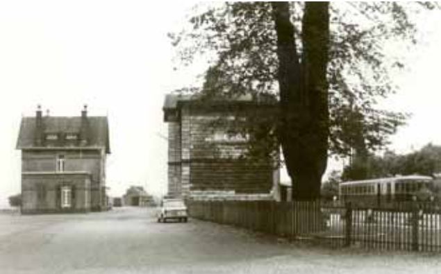
Les 2 gares en 1967

A Noerdange, une deuxième gare, située juste à côté de celle du Prince-Henri, desservait la ligne de chemin de fer à voie étroite qui conduisait les passagers trois fois par jour de Noerdange à Martelange grâce à un petit train à vapeur