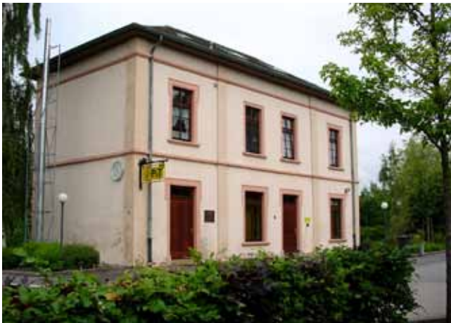
Gare devenue poste (2008)

Cet espace muséal est aujourd’hui divisé en quatre parties distinctes :