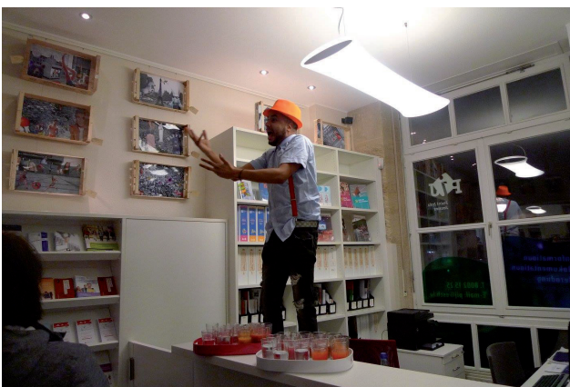
... und originelle Performances bei der Ver- nissage im PIJ Esch.