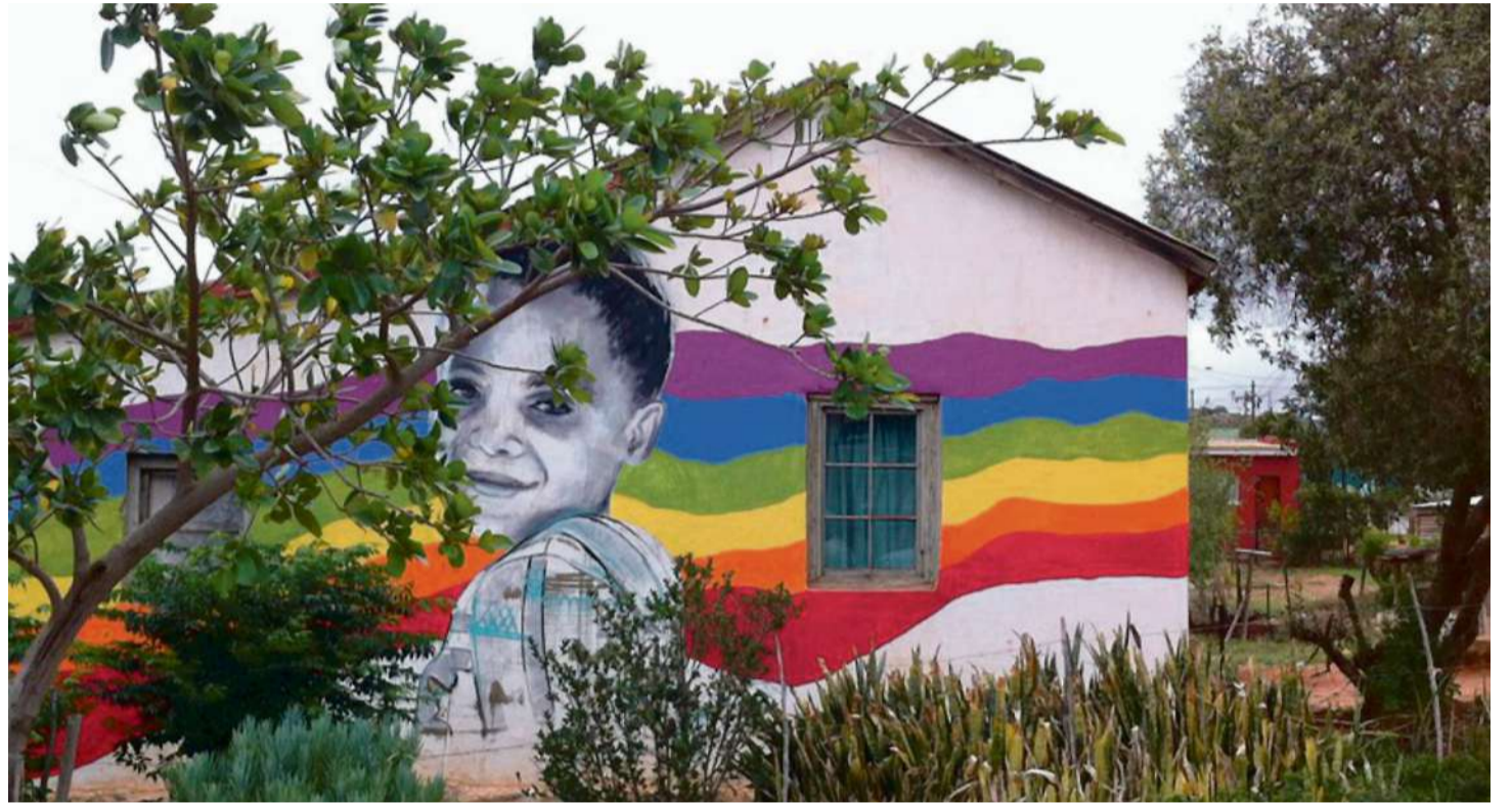
In Südafrika besteht Schulpflicht vom 7. bis zum 15. Lebensjahr