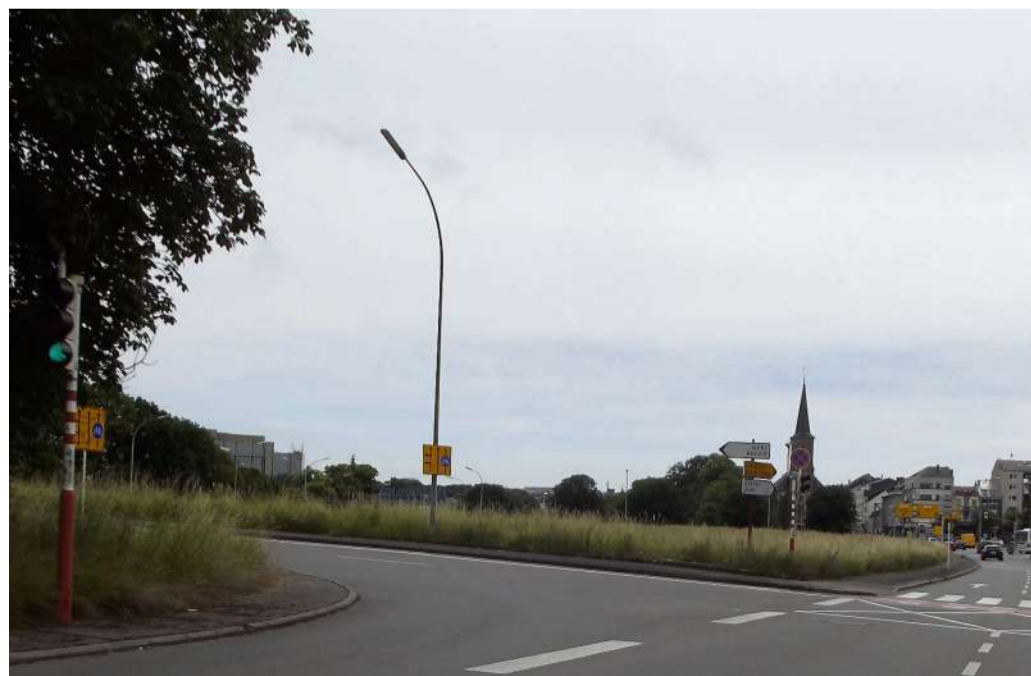
Anstelle ungenutzter Wiesen könnte man hier auch einen Park schaffen